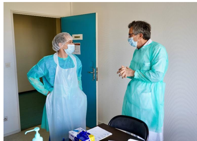
Unité de consultations COVID et avis des infectiologues