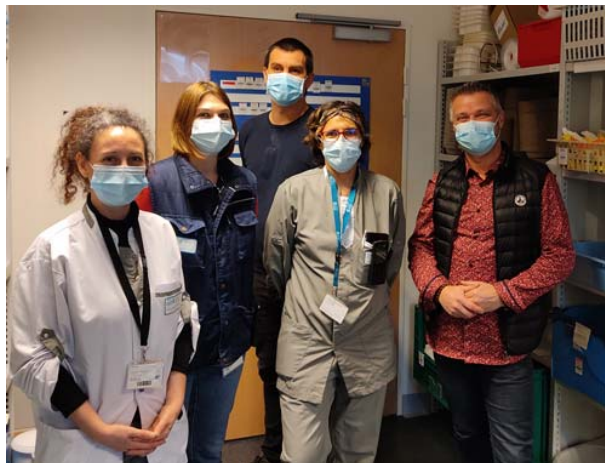
L'équipe qui a assuré le test de logistique d'étage