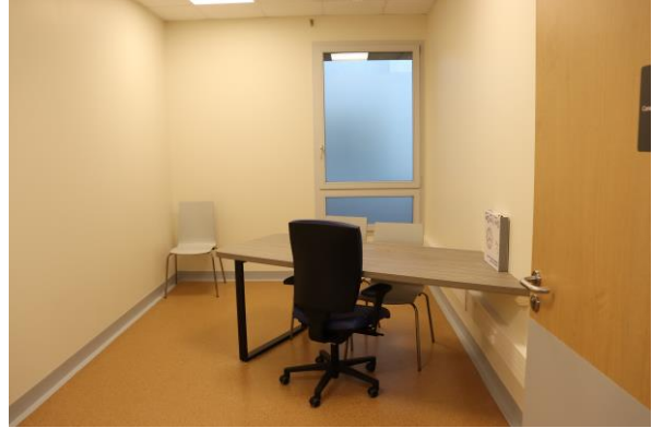
Salle de régulation et bureau de consultation