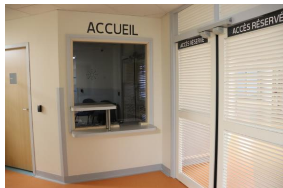
Entrée et accueil des Urgences Hospitalières Psychiatriques de l'EPSM de la Somme